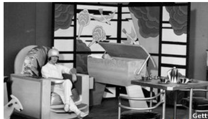
A los futuristas no les gusta hacer predicciones sobre tecnologías específicas.